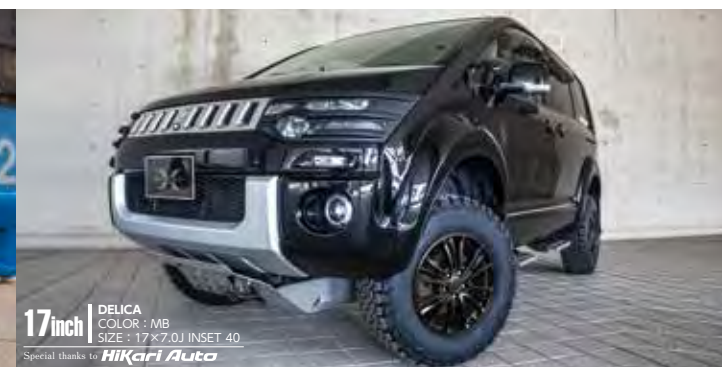
17inch DELICA COLOR: MB SIZE: 17×7.0J INSET 40 Special thanks to HiKari Auto