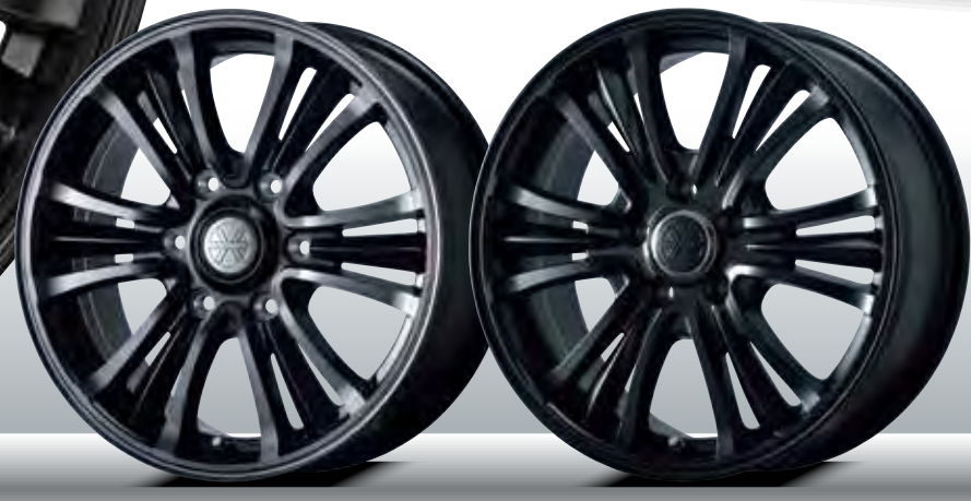
■ HIACE&CARAVAN (PB/BC) ■ 16/17inch 5Hole (MB)