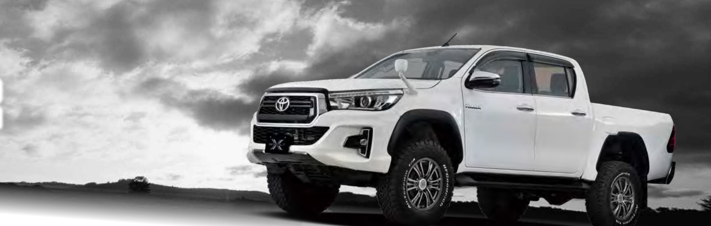
17inch HILUX COLOR: GMG SIZE: 17×7.5J INSET 25 Special thanks to FLEX