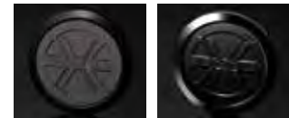
STANDARD (ブラッククロム) STANDARD (ブラックマット)