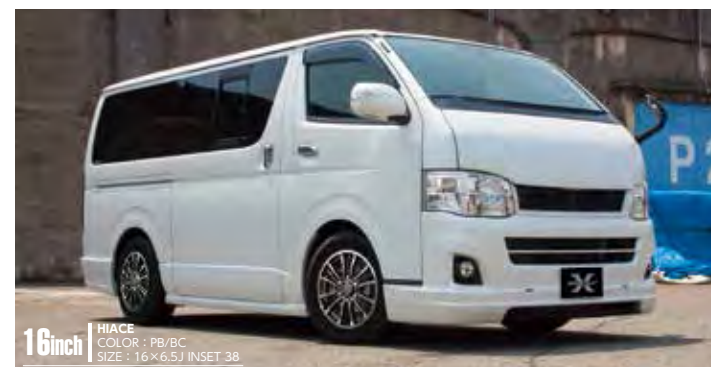
16inch HIACE COLOR: PB/BC SIZE: 16×6.5J INSET 38