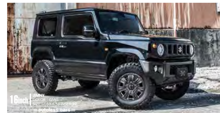
16inch JIMNY COLOR: GMG SIZE: 16×5.5J INSET 22 Special thanks to outless parts III