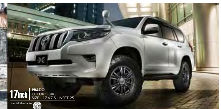
17inch PRADO COLOR: GMG SIZE: 17×7.5J INSET 25 Special thanks to