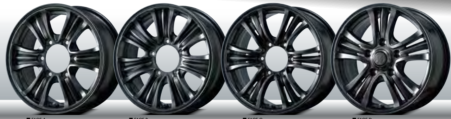
■ FACE-A ■ FACE-B ■ FACE-C ■ FACE-D