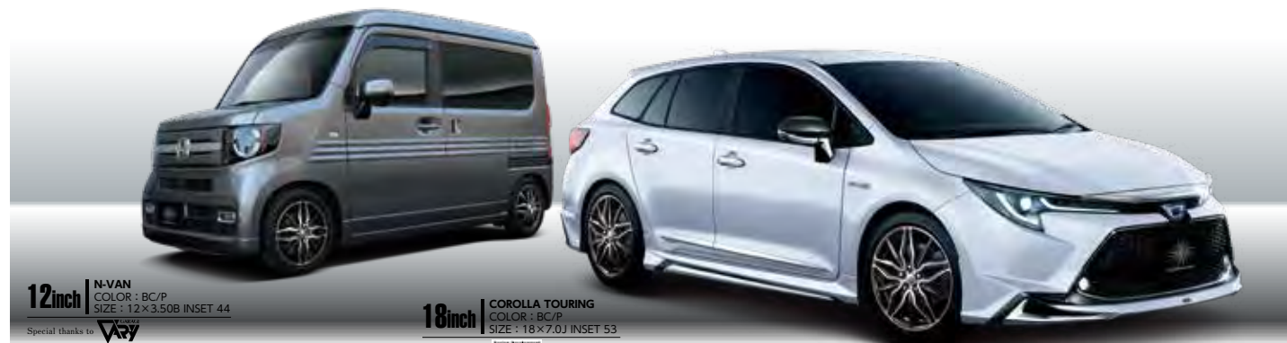
12inch N-VAN COLOR: BC/P SIZE: 12 × 3.50B INSET 44 Special thanks to VV