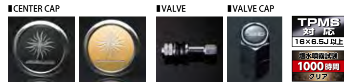
STANDARD (ブラック) STANDARD (マットゴールド)