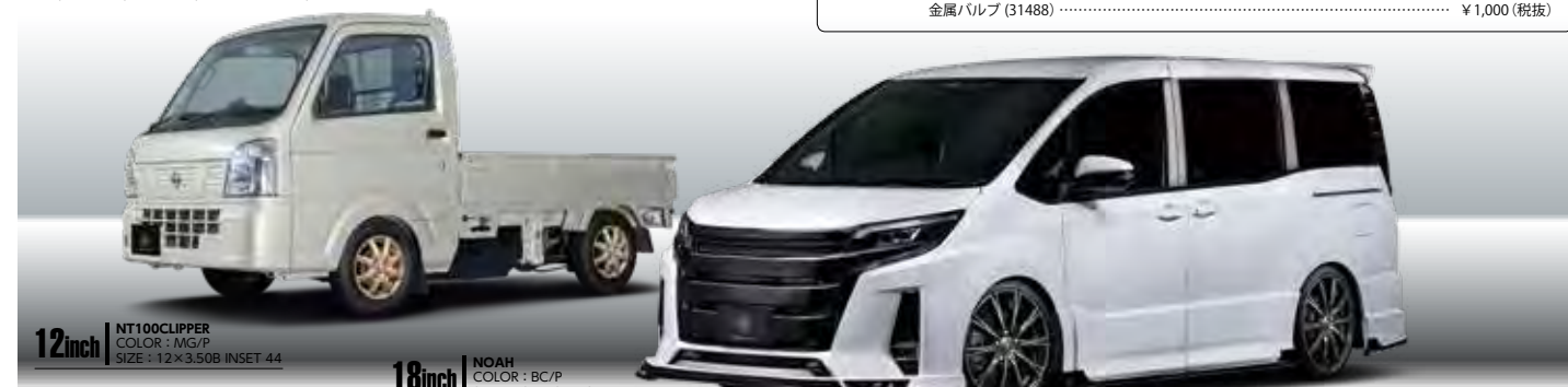
12inch NT100CLIPPER COLOR: MG/P SIZE: 12 × 3.50B INSET 44 Special thanks to M2 SPEED